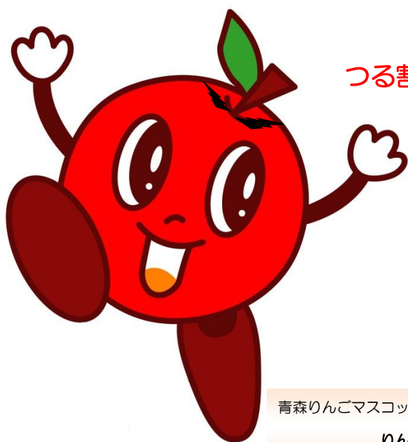
青森りんごマスコットキャラクター